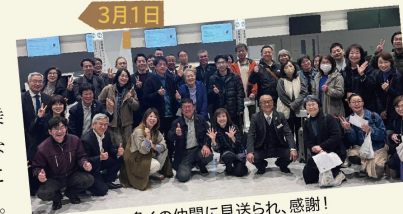
多くの仲間に見送られ、感謝!