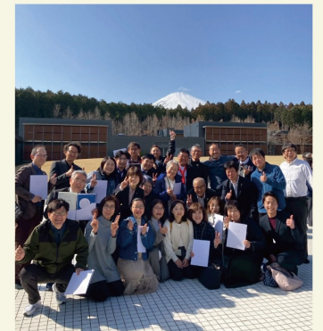
2泊3日、やり遂げました!