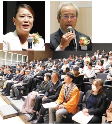
文・写真/玉名南倫理法人会 広報委員サブリーダー 島田 尚哉