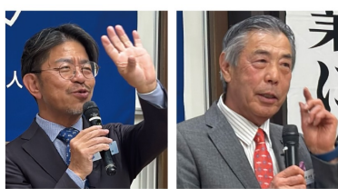
文・写真/熊本北倫理法人会 広報委員リーダー 坂川 聡