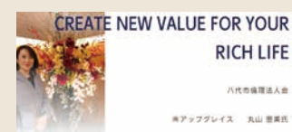
南アツグプレス 丸山 恵美氏