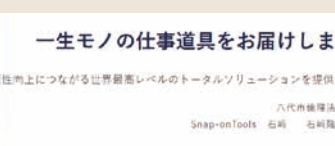
五五社市上につながる世界最高レベルのツールソリューションを提供する 八代市倫理法人会 Snap-on Tools 石崎 名昭隆氏