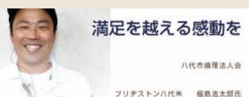
満足を越える感動を