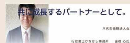
共に成長するパートナーとして。