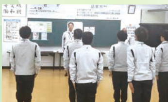
① 進行 開始15秒前です