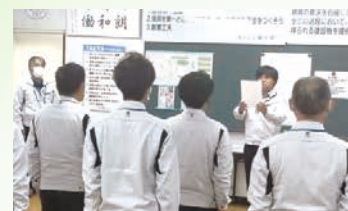
② リーダー挨拶 (社長) 社是、品質方針を斉唱 ③ 7ACTS (7つの基本動作) を読む