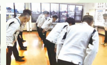
④ 挨拶実習&ハイの実践