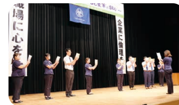
昨年の活力朝礼の様子