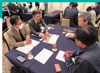
ロールプレイング