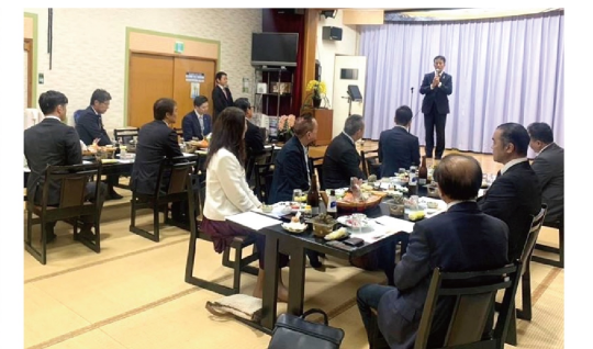
文/天草倫理法人会 広報委員長 松本 亮 写真/天草倫理法人会 専任幹事 渡邊 弘樹