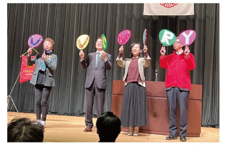
工夫満載の決意発表

次に7地区、25単会の地区長及び単会会長による個性と熱気あふれる決意発表があり、会場が笑いあいの明るいムードに包まれました。各単会、それぞれの目標に向かって必ず達成すると誓い合いました。最後に(一社)倫理研究所