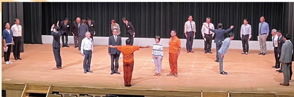
グループに分けて朝礼研修