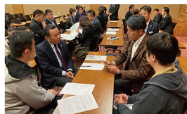
ロールプレイング