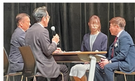
普及実践お手本の様子