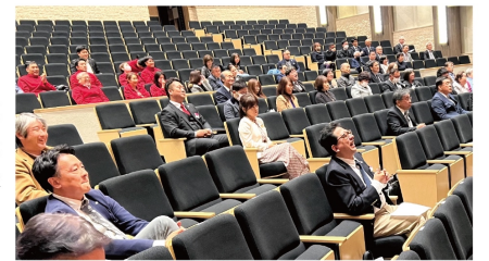
決意発表の様子を見る方も笑顔で応援!