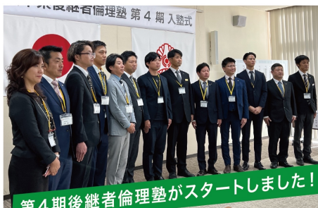
第4期後継者倫理塾がスタートしました!