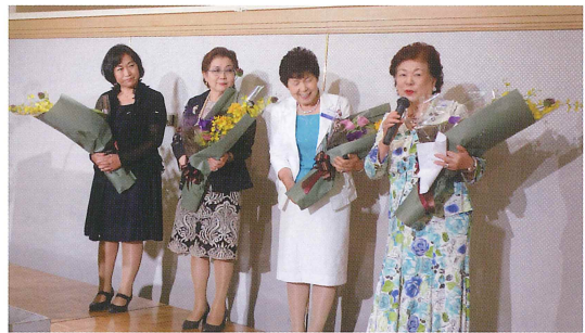
歴代の委員長さん