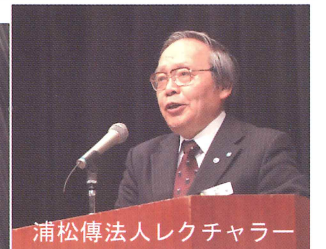
浦松傳法人レクチャー