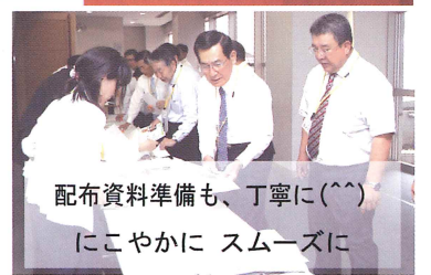
配布資料準備も、丁寧に(^^)にこやかに スムーズに