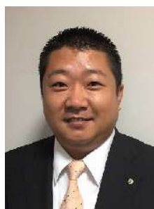
八代市倫理法人会 新入会員歓迎会

新人歓迎会に参加してみて、面白く、とても楽しい時間を過ごすことができました。色々なお話を聞いて